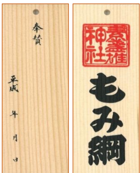
奉賛札(右:表面・左:裏面)